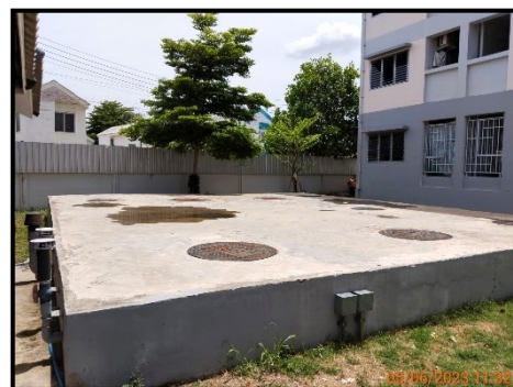
ระบบบำบัดน้ำเสียรวม