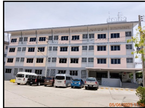
อาคารพักอาศัย