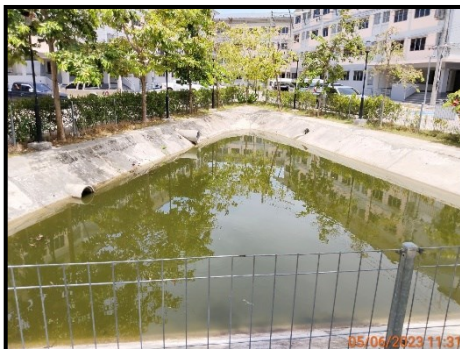
บ่อหนองน้ำ