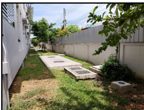
ระบบบำบัดน้ำเสียประจำอาคาร