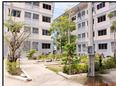
พื้นที่สวนสาธารณะ