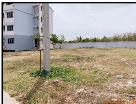
พื้นที่สำหรับพัฒนาในอนาคต